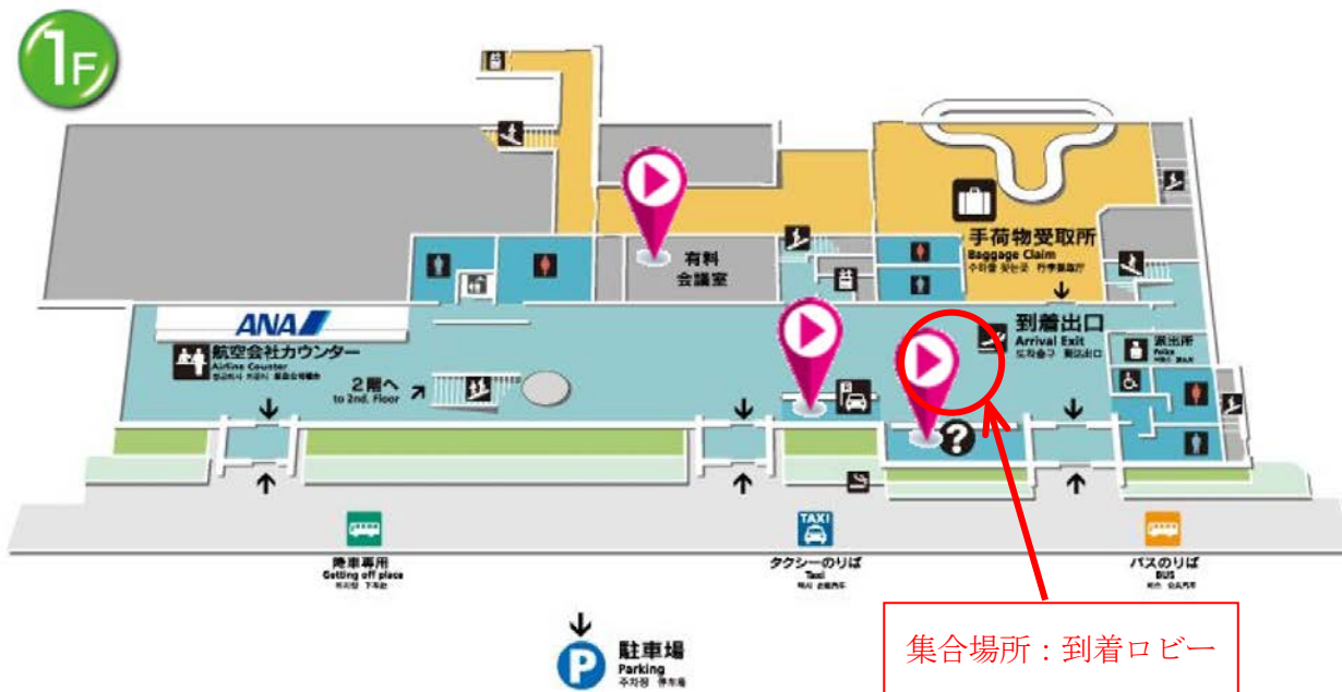
(集合場所の地図① 根室中標津空港到着ロビー)